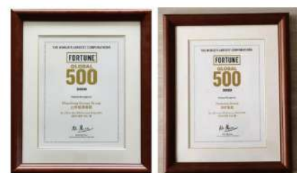
(四) 2020年原山东能源集团2020财富全球500强第212位原兖矿集团2020财富全球500强第295位