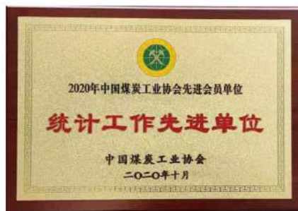
(一) 2020年中国煤炭工业协会先进会员单位统计工作先进单位