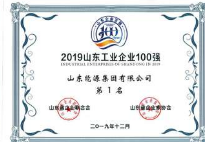
(六) 2019年度山东省工业企业100强第一名