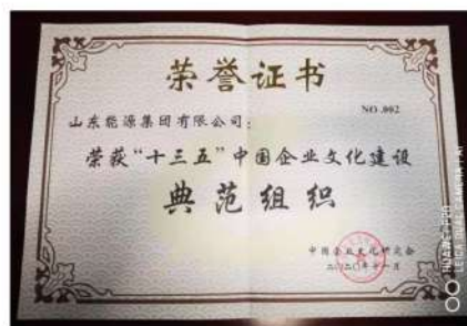
(五) 2020年荣获“十三五”中国企业文化建设的典范组织