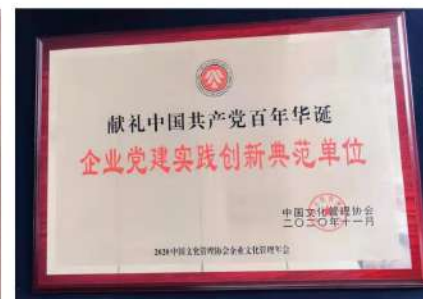
(二) 2020年被中国企业文化协会评为“献礼中国共产党百年华诞企业党建实践创新典范单位”