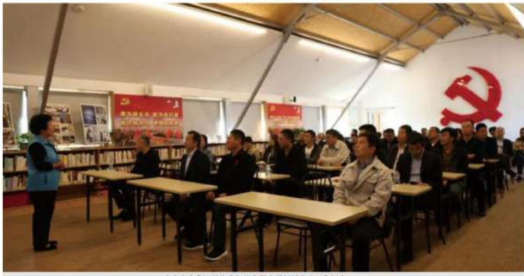
山东省中鲁远洋渔业股份有限公司创新党建工作纪实

公司党委持续强化政治担当，有效发挥政治引领和标杆示范作用，成立党建工作领导小组，编制公司党委 2020 年工作要点，严格执行“三重一大”事项决策制度。强化职责履行，实施党建考核结果与权属企业党委领导班子成员绩效薪酬挂钩，有效防止党建工作责任制落实力度层层衰减和“两张皮”现象。夯实监督责任基础，将党风廉政建设与生产经营共同部署。公司党委、纪委分别与权属企业党委、纪委签订落实党风廉政建设主体责任书和监督责任书，层层传导压力，实现党内监督常态化。推动建立“不忘初心、牢记使命”长效机制。完成纪检监察体制改革工作，建立完善党员领导干部廉洁风险动态管理机制，提升日常监督效能。深化政治巡察，从严从实抓好问题整改。严明政治纪律和政治规矩，深入落实中央八项规定精神，持之以恒纠正“四风”，大力整治形式主义、官僚主义，深入开展“以案为鉴、以案促改”警示教育并形成制度，一体推进建立不敢腐、不能腐、不想腐的机制。强化党建职责履行，从严治党实现全覆盖，对违规违纪保持零容忍。