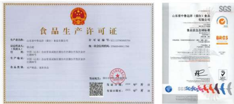
中鲁食品公司先后通过 HACCP 注册、欧盟认证、BRC 认证、MSC 认证、SEDEX 认证，提高了企业形象，稳固与客户的合作，拓宽国际市场

中鲁远洋公司认真履行 ISM 规则，保证海上安全，防止人员伤亡，避免对环境造成污染；所属中鲁食品公司认真开展环境监测工作，制定《年度环境监测计划》，加强污水处理设施的运行管理，每间隔 2 小时巡视设备运行状态，保障 24 小时全天有效运行。华特环保分公司依托产品设计技术优