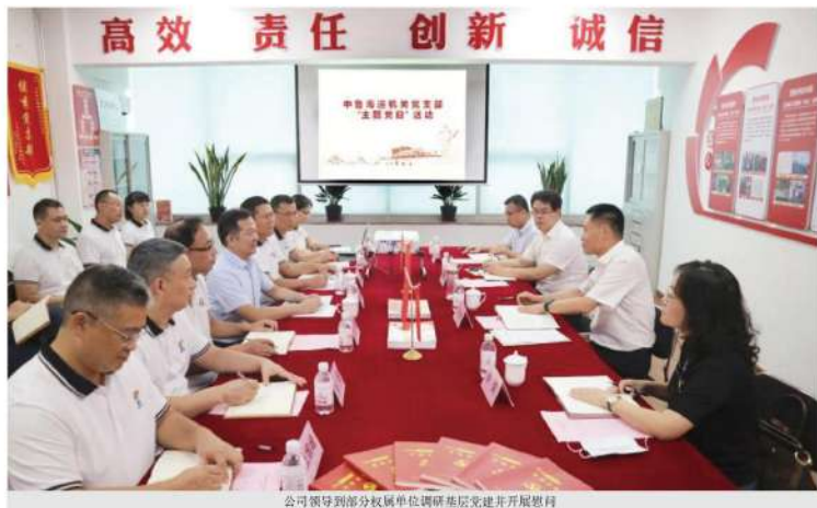
公司领导到部分权属单位调研基层党建并开展慰问

用活党建“指挥棒”。 推进考核评价融合，将党建工作全面纳入考核，把中心任务完成情况纳入基层党建工作考核，把基层党组织工作情况纳入基层班子绩效考核。华特控股充分发挥考核“指挥棒”作用，找准党建工作的着力点和落脚点，强化过程管控和结果评估，把党建工作与生产经营融为一体，形成“同布置、同考核、同奖罚”考核机制，把党建工作的考核结果作为评价领导班子及其成员工作实绩的重要内容，增强党建工作的实效性。