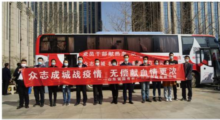
山东国投公司员工为抗击疫情献血捐款

〈三〉费用减免。 公司发挥国有企业带头作用，以实际行动支持中小企业健康稳定发展。印发《关于做好减免房租等政策落实工作的意见》，明确执行中的有关问题，对确实存在困难的企业，公司总部层面给予政策支持，有力支持受疫情影响严重的中小微企业发展。公司总部及权属企业泰富资产、鲁能公司、华特物业、轻工供销等公司及时将免租政策落到实处，累计为600余户中小微企业和个体工商户减免房租5000余万元。