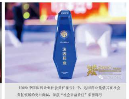
《2020中国医药企业社会责任报告》中，达因药业凭借其在社会责任领域的突出贡献，荣获“社会公益责任”荣誉称号