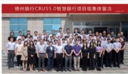
山东国投公司充分发挥国有企业在技术创新中的引领作用，强化自主创新