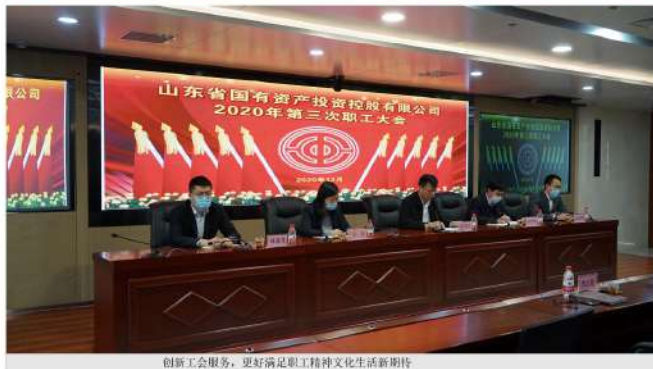
创新工会服务,更好满足职工精神文化生活新期待