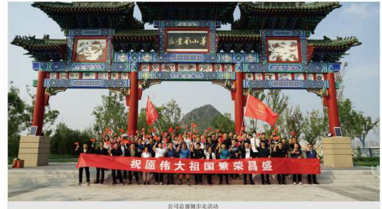
公司总部健步走活动