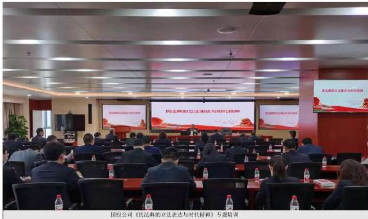
国投公司《民法典的立法表达与时代精神》专题培训

全面抓，重点防，加大管控力度。加强守法规教育，开展多层次、多形式的教育培训，组织开展“民法典”宣传月、法治宣传月、“知识产权宣传周”“防控疫情、法治同行”“服务大局普法行”“优化法治营商环境”等法治宣传活动。