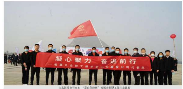
山东国投公司参加“泰山保险杯”省属企业职工健步走比赛