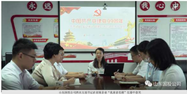
山东国投公司两名支部书记在省属企业“我来讲党课”比赛中获奖

有力推动基本队伍建设更加过硬。 坚决抓牢“关键少数”，严格落实“20 字”好干部标准，将党建工作纳入干部考察考核重要内容。新提拔公司党委管理的干部中 70% 以上具有党务工作经历。抓牢“党务干部”，注重选拔党性强、素质高、懂经营、口碑好的优秀人才成为党务工作者，专兼职党务工作人员达到 370 余人。不断强化党性教育，加强能力建设，各级党组织培训党支部书记、党务工作者 1100 余人次。抓牢“骨干力量”，落实“双培养”制度，把业务骨干培养成党员、把党员培养成骨干，建成以党员为核心的骨干人才队伍。广泛开展“一个支部一座堡垒、一名党员一面旗帜”“党员示范岗”“党员突击队”等岗位建功活动，在项目建设、生产经营重点难点环节上建立党员先锋岗 221 个、党员突击队 88 支、党员责任区 131 个，充分发挥党员在改革发展、出疆治亏等急难险重任务中当先锋、作表率作用，涌现了浪潮云数据中心国家实验室党支部、中鲁远洋加纳代表处党支部等一批先进典型。