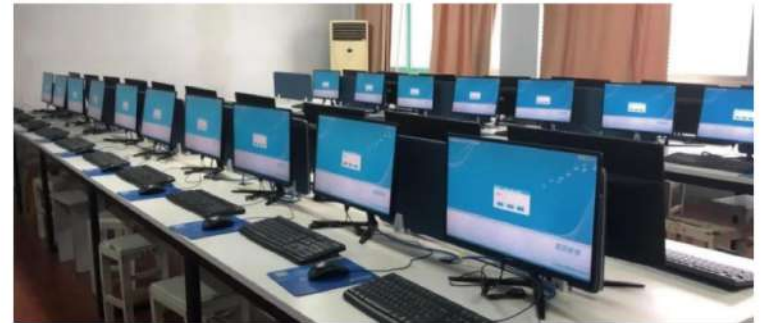
免费提供在线教育平台，发展“互联网+教育”

〈四〉稳岗就业。 积极响应省委省政府《关于积极应对新冠肺炎疫情做好稳就业工作的若干措施的通知》要求，在人员招聘、创造留人环境、提高员工技能水平等方面多措并举，稳岗就业。浪潮集团线上启动校园招聘“万人计划”，基于自研的“云+、HCMS Cloud”等平台实施“不接触 有温度”的全程在线校园招聘方式，扩大招聘岗位，助力毕业生网上求职。华特集团助力复工复产，积极与相关部门沟通协调，2020驻济各单位共计免缴200余万元社保费。中鲁食品主动开通“返岗直通车”，赴河南以“点对点、一站式”直达方式接员工返岗复工。轻工供销等其它企业通过防疫物资发放、提升员工薪资水平、实施年金计划、无减员裁员等措施，做到现有队伍不做减法、人员引进做好加法，尽一份国企责任。