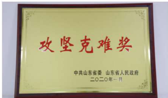
山东国投公司加强人才队伍建设，优化人力资本积累，提高员工综合胜任能力

创新业务与管理能力培训，提高员工综合胜任能力。 坚持技能培训与提升高素质职工队伍有机结合，创建学习型企业，实现员工与公司共成长。完善干部、人才队伍规划和职业生涯规划，积极营造引才、育才、用才的良好环境。加强对职工的职业技能培训，大力培养急需的各类技能人才，支持帮助困难企业开展职工转岗转业培训。各部门加强业务沟通，强化协作，搭建了交流思想、业务探讨的平台。开展新员工岗前培训、管理知识培训、风险管理培训、普法教育、安全生产培训等系列活动，提高了干部队伍整体业务水平和履职能力。