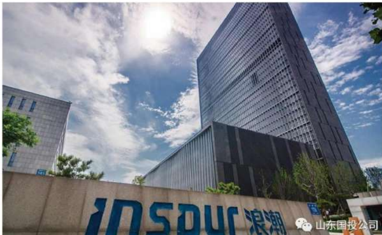
2020年《全球人工智能市场半年度跟踪报告》显示，浪潮以15.5%的市场占有率，位居全球AI服务器市场第一，浪潮AI服务器中国市场市场份额已连续三年保持50%以上

在现代海洋渔业板块，积极推进国家级“中鲁远洋国际金枪鱼创新产业园”建设，在巩固国际市场的同时，着力开发国内市场，发力内循环，致力于产业链融合发展。在医药健康板块，大力推动治疗药物研发及儿童用药关键技术平台建设，加快布局全产业链步伐，行业领军优势更加巩固。参与济川药业非公开发行，促进儿科制药业务联动。加快推动公司内部资源整合，完成投资类企业泰富资产对百特投资，东银投资与丝绸集团的整合，水利施工类企业水总公司与水局公司的股权对外划出，交通运输类企业山东交运集团的国有股权划入公司。