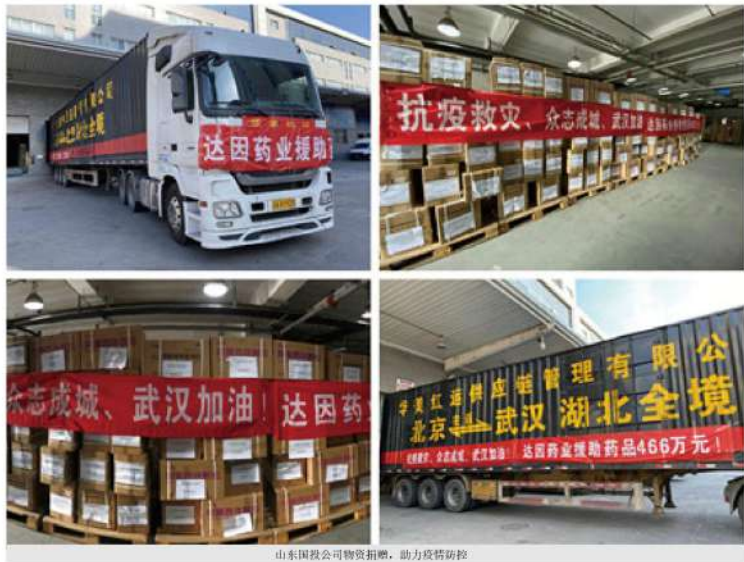
山东国投公司物资捐赠，助力疫情防控

（二）物资捐赠。 疫情期间，充分调动各权属单位医疗、医药资源，积极配合当地政府，做好应急物资调配，备齐齐全救治药品、医疗器械和防护用品。加强与疫区政府、相关机构紧密沟通协助抵抗疫情。浪潮集团向湖北疫情最前线提供 10 万余件医疗防疫物资。省丝绸集团发动广大党员干部向疫情严重地区捐款 25 万元。省医药集团所属济南益寿堂大药房、日照真诚大药房等 200 家药店全员上岗，保持正常营业，对口罩、消杀用品等坚决不涨价，组织职工向武汉地区捐款 10 万元。济南市医药公司、日照佳业医药公司捐赠价值 20 万元的酒精、84 消毒液、一次性手套等紧缺物资。烟台站协助烟台市政府购进口罩 20 万只，竭力保障合作医疗机构防疫应急物资供应。达因药业向湖北捐赠 466 万元医药物资，加班加点生产氯酸钠消毒剂，向公交系统、地铁、高铁、医院、学校进行消毒剂的无偿捐赠。