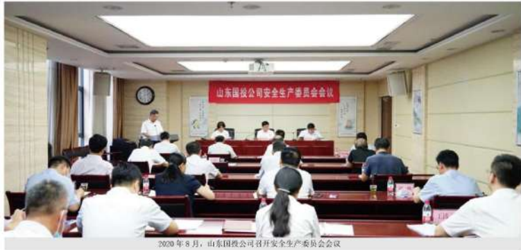
2020年8月，山东国投公司召开安全生产委员会会议

公司认真学习贯彻习近平总书记关于安全生产的重要论述指示精神，贯彻落实上级部门安全生产工作的部署要求，统筹发展与安全的关系，树牢安全发展理念，把安全生产摆到重要位置。在公司党委领导下，建立健全了公司安全生产委员会组织架构体系，完善安全生产责任制和管理机制，修订安全生产规章制度，积极构建安全风险分级管控和隐患排查治理的双重预防机制，完善风险防范化解机制，提高安全生产工作水平。扎实开展安全生产巡查和专项检查，对权属企业现场检查，